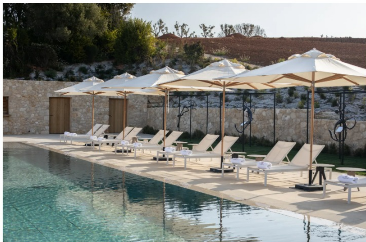
Spa Olivier Claire au Château de la Gaudé, 3059 route des Pinchinats, 13100 Aix-en-Provence. Réservations au 04 84 930 932 et contact@chateauadelagaude.com

C'est au milieu des vignes, juste derrière la magnifique bastide du 18 e siècle et ses longères, que le spa Olivier Claire du Château de la Gaudé , s'étend majestueusement. Marcel Pagnol y a même tourné l'une des scènes du film Le Château de ma mère ... Ici, au cœur de la Provence, le temps semble s'être arrêté. Seul le bruit des cigales, et de la brise parcourant les oliviers, rythment ce moment suspendu. Il suffit d'ailleurs de pénétrer dans cette hacienda du bien-être, habillée de pierres blanches et de bois naturels, pour que le mental s'apaise et que le corps s'ancre un peu plus dans la terre provençale . Logique, que la jolie marque française Olivier Claire , pour qui la nature a toujours été la plus grande source d'inspiration, ait décidé de s'y installer. Car tout a été pensé pour se ressourcer au plus proche des éléments. Le jardin privé verdoyant, accueille de longs bains de soleil ombragés. Les douches sensorielles, le sauna, le hammam appellent aux voyages à travers le monde. La large piscine, d'un bleu hypnotisant, se transforme suivant l'envie en bassin rafraichissant ou en activité sportive.