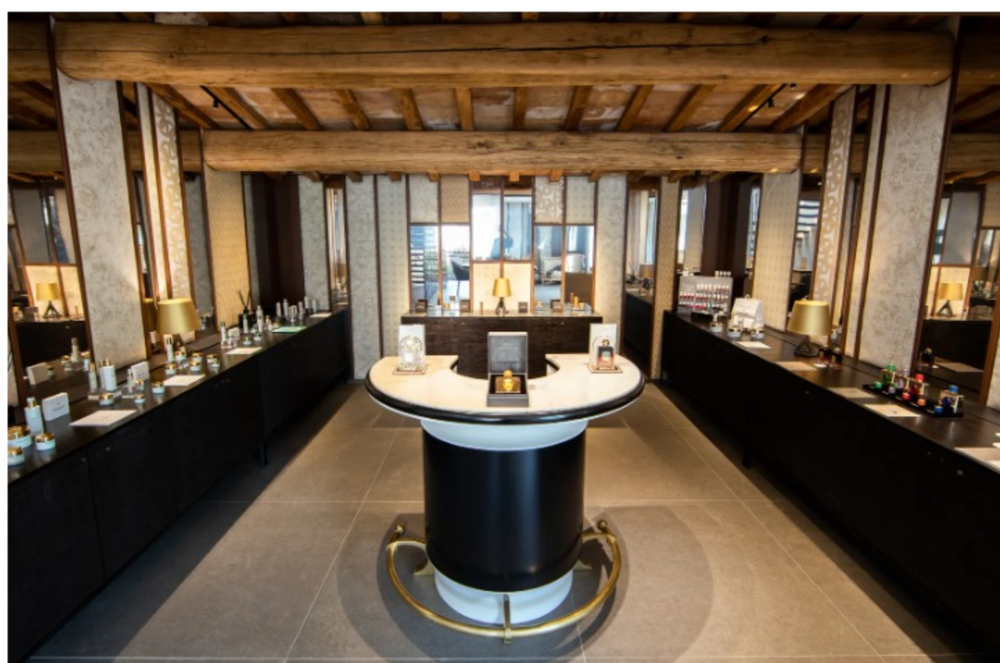
Spa Olivier Claire au Château de la Gaudé, 3059 route des Pinchinats, 13100 Aix-en-Provence. Réservations au 04 84 930 932 et contact@chateauadelagaude.com

Dans la droite lignée de l'esprit des lieux, Olivier Claire imagine une série de protocoles de haute volée, dont certains en exclusivité. C'est le cas du Soin Haute Couture (105 min, 285 €), qui conjugue l'excellence des formules de la marque à une gestuelle sur-mesure, pour réoxygéner la moindre cellule du visage. Ou encore, le Soin Collection Capsule B . (115 min, 310 €), qui s'attelle à détendre et régénérer le corps en entier. Avec une mention spéciale pour le Soin Visage Hydratation Intense (75 min, 190 €) pour repulper les épidermes assoiffés après une journée au soleil.