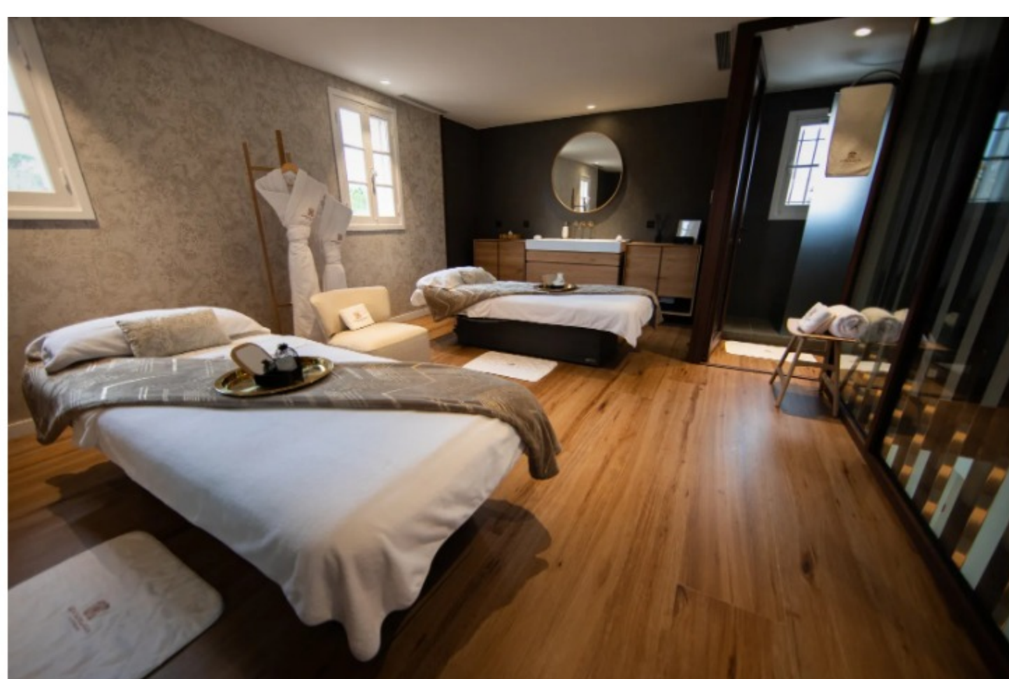
Spa Olivier Claire au Château de la Gaudé, 3059 route des Pinchinats, 13100 Aix-en-Provence. Réservations au 04 84 930 932 et contact@chateauadelagaude.com

Dans la droite lignée de l'esprit des lieux, Olivier Claire imagine une série de protocoles de haute volée, dont certains en exclusivité. C'est le cas du Soin Haute Couture (105 min, 285 €), qui conjugue l'excellence des formules de la marque à une gestuelle sur-mesure, pour réoxygéner la moindre cellule du visage. Ou encore, le Soin Collection Capsule B . (115 min, 310 €), qui s'attelle à détendre et régénérer le corps en entier. Avec une mention spéciale pour le Soin Visage Hydratation Intense (75 min, 190 €) pour repulper les épidermes assoiffés après une journée au soleil.