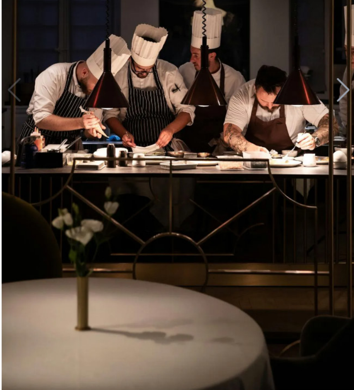
Il ristorante stellato Le Art dell'hotel Château de la Gaude in Provenza

«Questo luogo invita a immersersi nella bellezza e nella storia di una delle regioni più affascinanti della Francia».