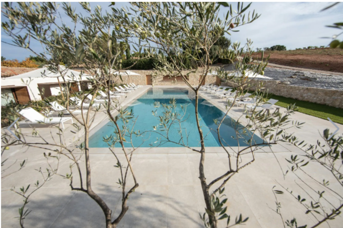
La spa, la palestra e la piscina dell'hotel Château de la Gaude in Provenza

Le sette camere e suite all'interno del castello rappresentano un'ode alla raffinatezza, con decorazioni sobrie, pareti bianche, parquet d'epoca e dettagli in marmo che si uniscono armoniosamente a tutte le comodità moderne. Ogni stanza offre una vista incantevole sui giardini alla francese, restaurati dal paesaggista Thomas Gentillini , e sulle colline circostanti, invitando gli ospiti a lasciarsi incantare dalla bellezza naturale che li avvolge.