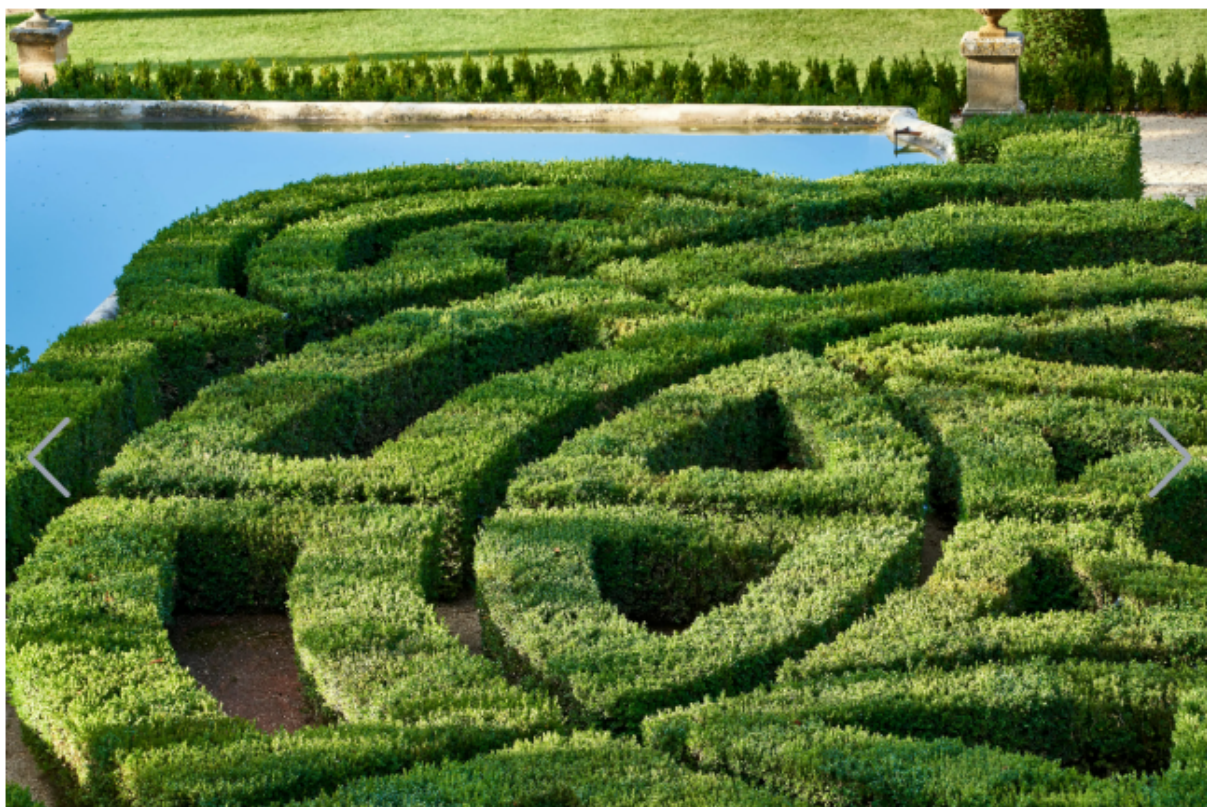
I giardini e gli esterni dell'hotel Château de la Gaude in Provenza

«Tra arte, design, enogastronomia e natura, si celebra lo stile di vita provenzale, in un contesto che unisce passato e presente, tradizione e innovazione».