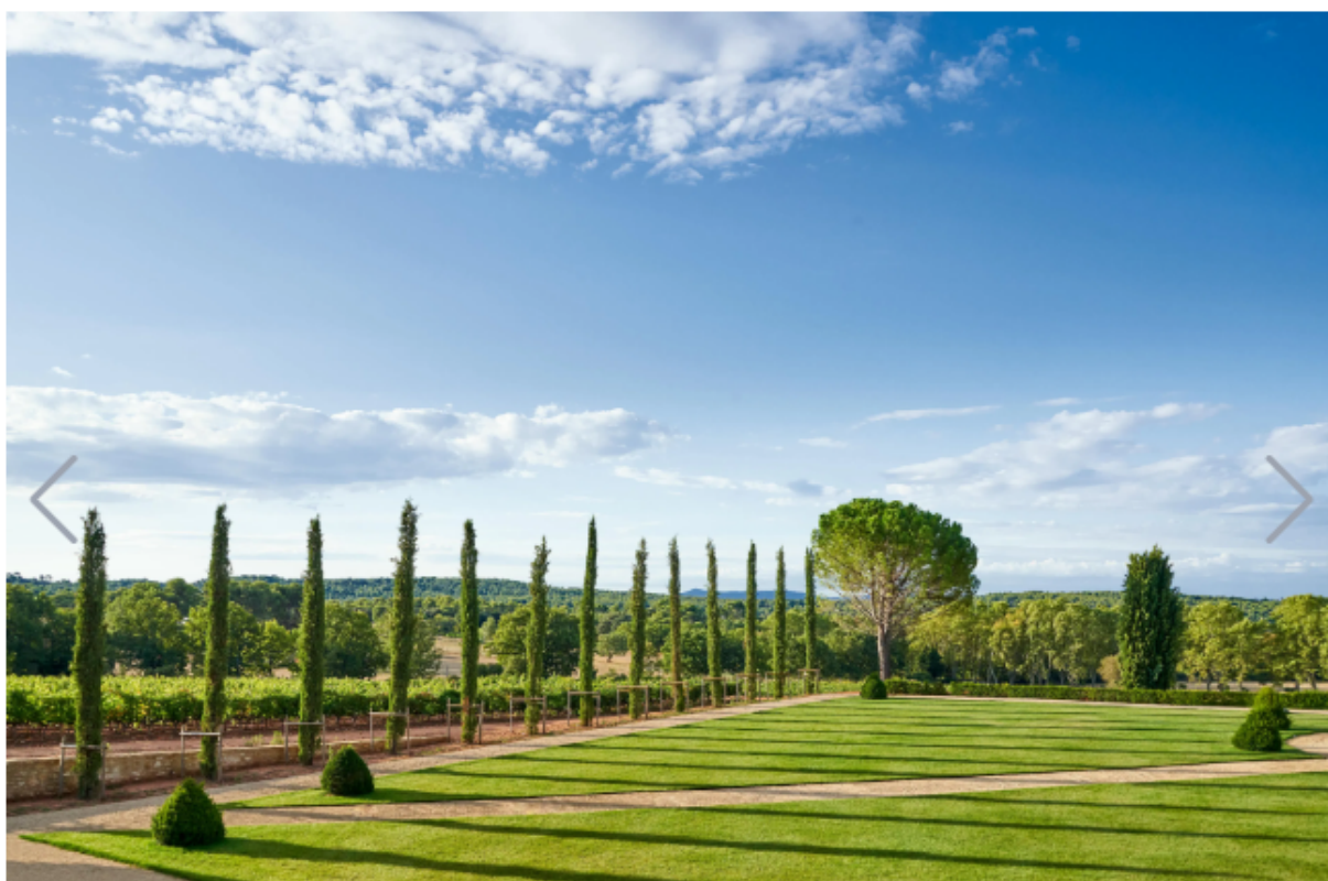
I giardini e gli esterni dell'hotel Château de la Gaude in Provenza

In Provenza esiste un luogo dove il tempo sembra fermarsi, dove i colori della terra si fondono con il blu del cielo e l'aroma della lavanda si intreccia con quello delle vigne mature. Immerso tra le colline di Aix-en-Provence , si trova l' hotel Château de la Gaude , una residenza del XVIII secolo pronta ad accogliere chi desidera regalarsi un'experience di lusso immersa nella bellezza e nella storia di questa regione unica.