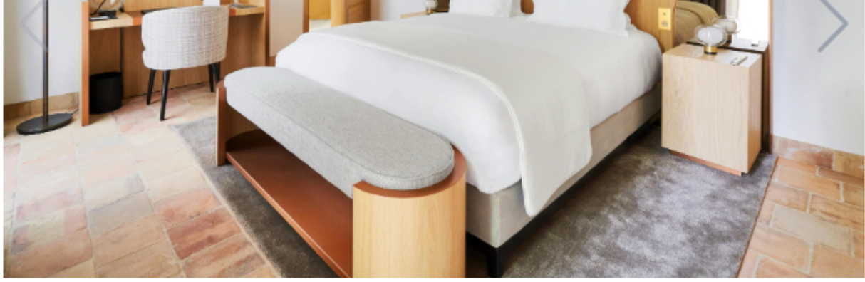
Gli interni e alcune stanze dell'hotel Château de la Gaude in Provenza

Come se non bastasse, la cucina del Château de la Gaude rappresenta un'esperienza a sé. Nei quattro ristoranti della tenuta, lo chef stellato Matthieu Dupuis Baumal guida una brigata che riesce a reinterpretare il territorio provenzale con creatività e abilità tecnica. Al ristorante gastronomico Le Art , la cucina diventa un viaggio tra sapori locali e influenze globali, con piatti che combinano continenti e ricordi di viaggio, utilizzando i migliori prodotti del territorio. Le creazioni culinarie dello chef, premiate con una stella Michelin, sono un'autentica festa per i sensi, capaci di stupire e deliziare anche i palati più esigenti.