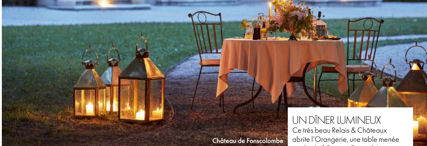
Château de Fonscolombe

CONCERTS, EXPOS, RANDONNÉES... CET ÉTÉ, ON DÉCOUVRE LES DOMAINES VITICOLES AIXOIS SOUS UN AUTRE ANGLE. PAR AGLAË DE CHALUS